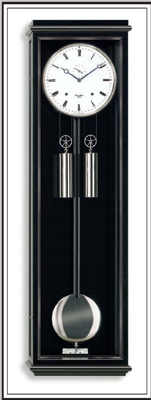
Modèle Classica S100

Durée de fonctionnement un mois, avec sonnerie discrète à la demi-heure. Le fabricant d'horloges de style Sattler a été l'artisan d'une brillante renaissance du régulateur viennois classique.