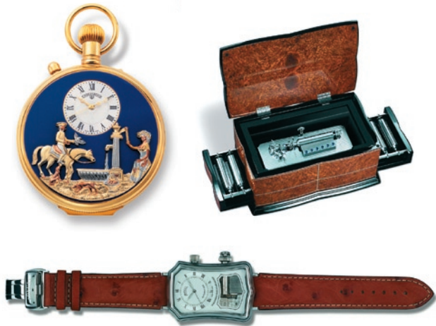
Montres musicales suisses à bracelet et de gousset de Boegli et Reuge

Les belles horloges vous permettent de vivre avec style avec le temps, et non pas contre lui sans trêve ni repos.