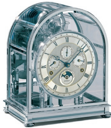
Kieninger modèle 1709

Durée de fonctionnement un mois, avec sonnerie discrète à la demi-heure. Le fabricant d'horloges de style Sattler a été l'artisan d'une brillante renaissance du régulateur viennois classique.